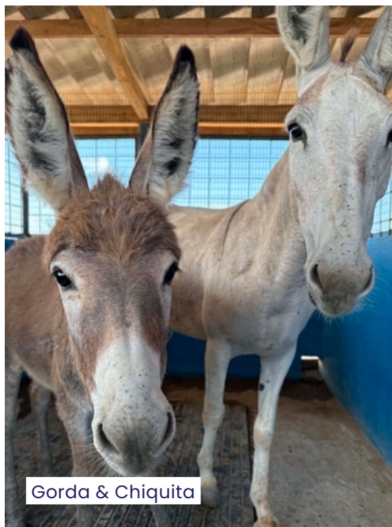
Gorda & Chiquita

Dochter Chiquita blijft natuurlijk veilig aan haar zijde. Samen mogen ze voortaan de rest van hun leven veilig bij ons in de sanctuary wonen!